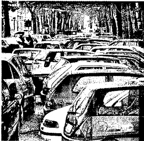
LIBERI DAI PARCHEGGI Renzo Piano vede una città del futuro senza grandi parcheggi né tunnel