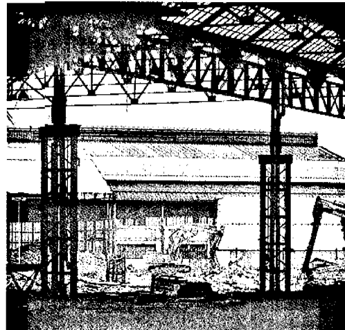
EX FALCK Un nuovo quartiere prenderà il posto dell'ex area Falck di Sesto San Giovanni