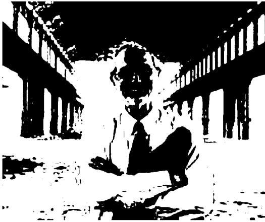
ARCHITETTO Renzo Piano nell'area Falck di Sesto