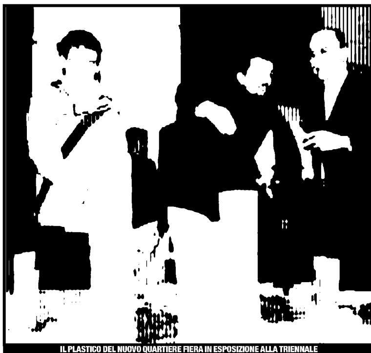
IL PLASTICO DEL NUOVO QUARTIERE FIERA IN ESPOSIZIONE ALLA TRIENNALE

Daniel Libeskind è nato in Polonia ma ora è americano