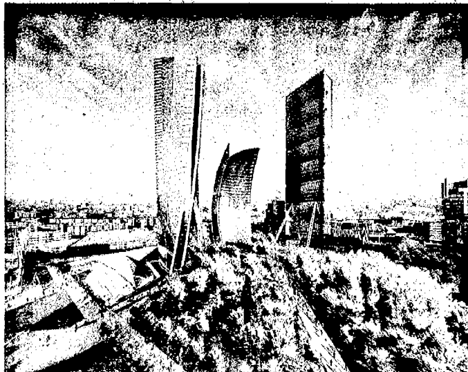
PROGETTO CITYLIFE L'assessore alla cultura aveva già criticato il progetto: «I nuovi edifici devono tenere conto dell'ambiente circostante, cosa che qui non avviene»