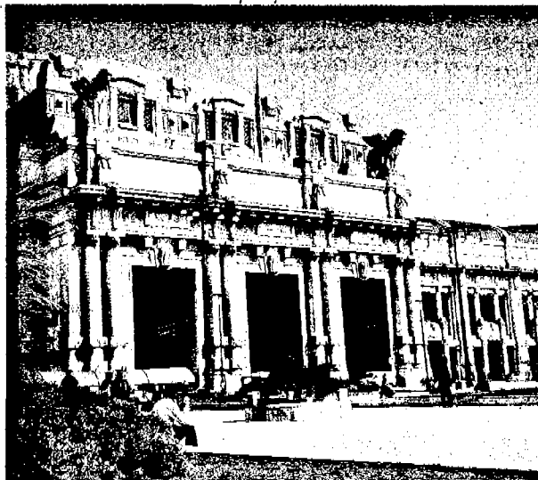
AFFRESCHI IN PERICOLO: «Questo lo blocciamo» dichiara il critico al solo sentire nominare sopralci che andrebbero a coprire i dipinti di Rizzoli alla Stazione