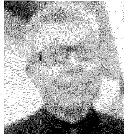
MUSEO L'architetto americano Daniel Libeskind